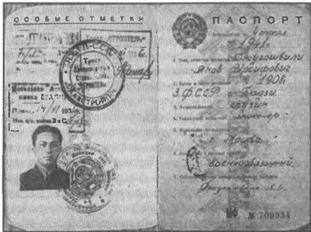
Паспорт Якова Джугашвили. В графе «Место рождения» написано: «Село Бадзи». А не «Баку», как утверждал мнимый сын Сталина

Зачем гитлеровцы пошли на такую пропагандистскую акцию, объяснить, очевидно, нет никакого смысла. И так все понятно. Что же касается реальной судьбы Якова Джугашвили, то она из тех, о которых высшими законами справедливости положено говорить так — пал смертью храбрых в боях за свободу и независимость нашей Родины! Потому, что один из уцелевших в том последнем бою в окрестностях села Копти Витебского района солдат впоследствии рассказал приемному сыну Сталина — генералу Артему Сергееву, — что Яков Иосифович, как и все оставшиеся в живых военнослужащие его артиллерийской бригады, пошли на прорыв, в рукопашный бой. Старший лейтенант Яков Иосифович Джугашвили-Сталин, к глубокому сожалению, из этого боя живым не вышел. Последнее, что видел этот солдат перед тяжелой контузией, что Яков был весь в крови. Когда же немцы обнаружили тело погибшего старшего лейтенанта Я.И. Джугашвили-Сталина, то тогда и родилась у них идея разыграть фарс с его